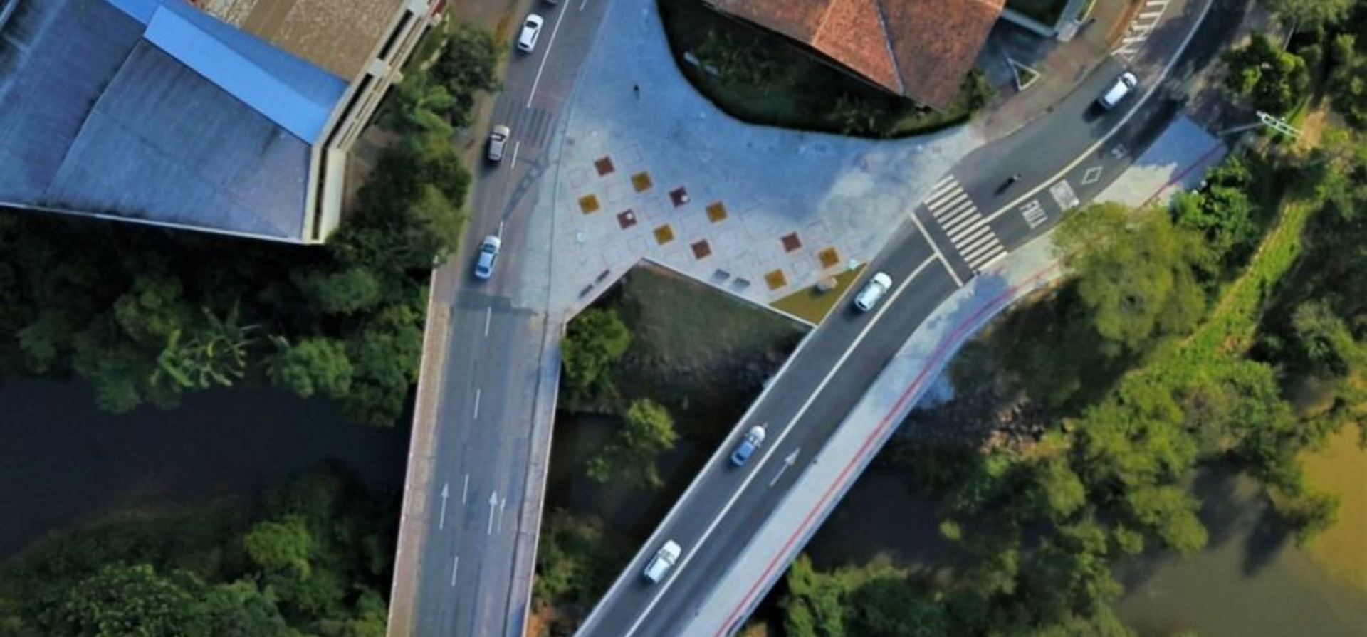
Ponte Ruy Eduardo Willecke