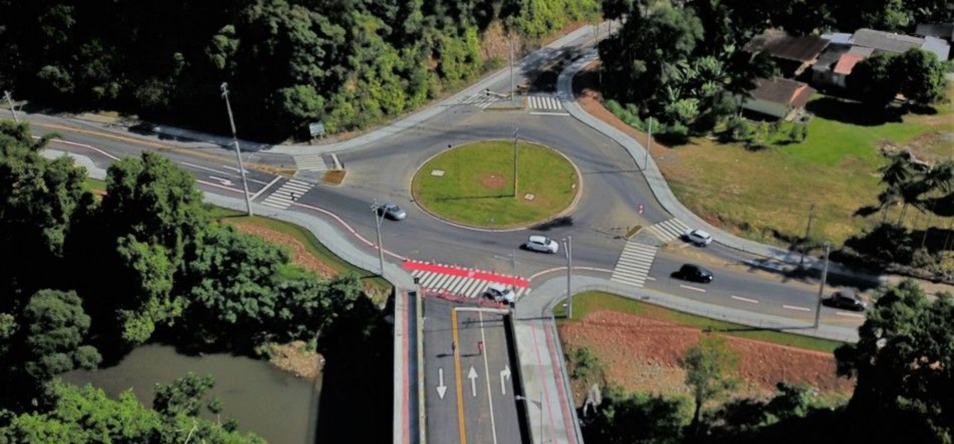
Ponte da Rua Maria Cavilha (Ponte do Mirelo) e rotatória da Rua Hermann Huscher concluídas