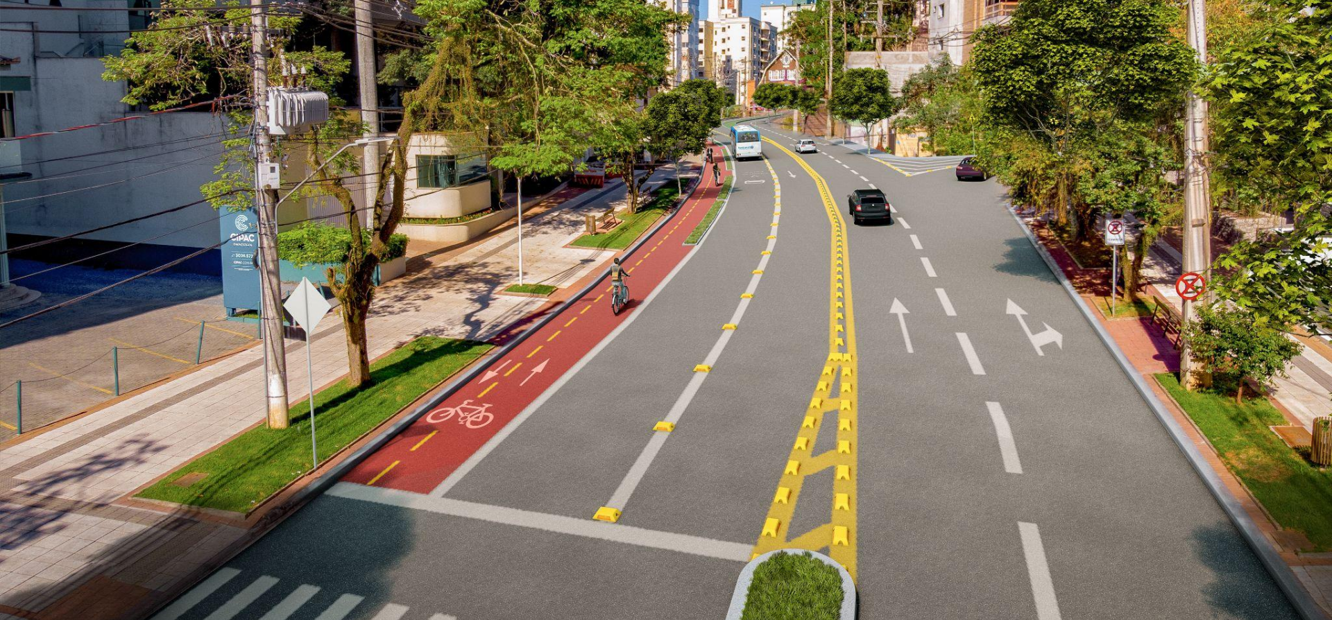
Trecho 03, chegada da Rua Hermann Huscher, na Alameda