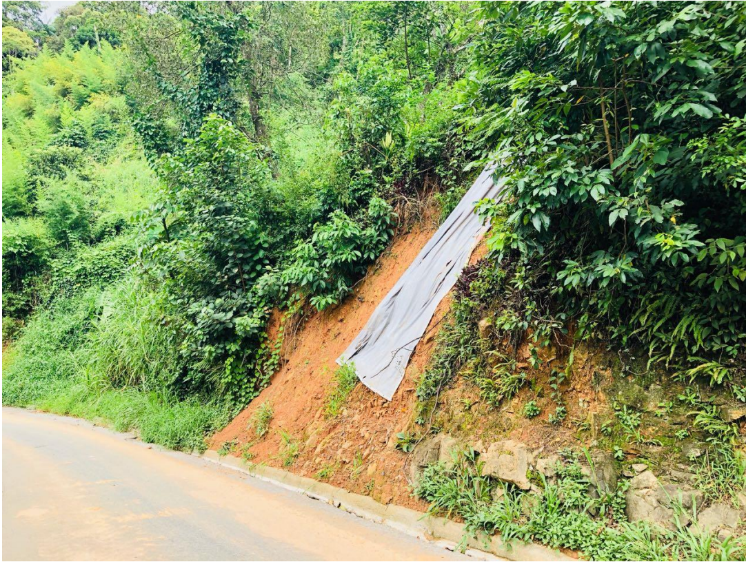
Rua Júlio Heiden, Progresso